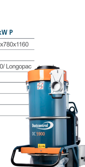
Art.nr. DC 5900 9,2 kW S c/a 119340 a 400 V 119341 c 400 V

Levereras med (Art nr) Finfilter, polyester (4292) HEPA H13 filter (42807)