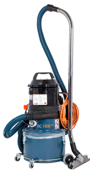
Art.nr. DC 1800 H 101800 230 V/50 Hz 101801 230 V/50 Hz Auto start

Levereras med (Art nr) Sugslang med muff (Ø 38 mm), 5 m (2105) Anslutningsmuff (2108) Golvmunstycke (B370 mm) (7235) Sugrör Ø 38 (7257) Plastsäck (42292) Säcks töd (42369) Finfilter, cellulosa (42029) HEPA H13-filter (42027)