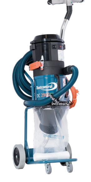
Art.nr. DC 2900 H 121100 a 230 V/50 Hz Auto Start 120100 c 230 V/50 Hz Auto Start 122100 L 230 V/50 Hz Auto Start

Levereras med (Art nr) Sugslang (Ø38 mm) med muff, 5 m (2105) Anslutningsmuff (2108) Golvmunstycke B370 (7235) Sugrör Ø 38 mm (7257) Plastsäck (42702) Finfilter, cellulosa (42029) HEPA H13-filter (42027)