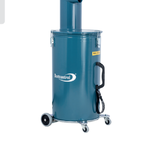
Art.nr. DCF 60 7069 med hjulsats