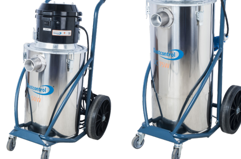
Art.nr. DC 50-W 118600 230 V, 50 Hz, EU Art.nr. DC 75-W 118700 230 V, 50 Hz, EU

Levereras med (Art nr) Anslutningsmuff (2108) Anslutningshylsa (2115) Sugslang Ø 38 mm, 5 m antistatisk (2012) Golvmunstycke B370 mm (7236) Sugrör Ø 38, aluminium (7258) Filtersäck (42190)