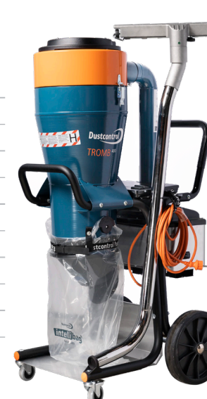
Art.nr. DCTROMB 400 172000 a 230 V 3000 W 171500 c 230 V 3000 W 171530 L 230 V 3000 W

Levereras med (Art nr) Anslutningshylsa (2129) Anslutningsmuff (2008) Sugslang antistatisk (Ø 50 mm) 5 m (2013) 171530 och 172000 Sugslang (Ø50 mm) 5 m (240105) för modell 171500 Golvmunstycke B500 mm (7238) Sugrör (Ø 50 mm) (7265) Sugrör (Ø 50 mm) (7265) Finfilter, polyester (44017) HEPA H13-filter (44016)