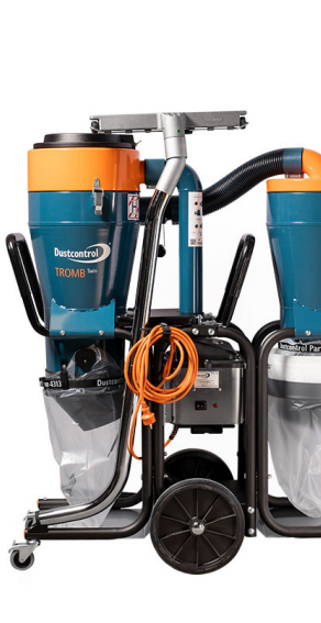
Art.nr. DCTROMB H 400 Twin 172540 aL TWIN 230 V/3000 W 172550 LL TWIN 230 V/3000 W 172520 aa TWIN 230 V/3000 W 172500 cc TWIN 230 V/3000 W 172530 cL TWIN 230 V/3000 W

Levereras med (Art nr) Anslutningshylsa (2129) Anslutningsmuff (2008) Sugslang antistatisk (Ø 50 mm) 5 m (2013) Golvmunstycke (B500 mm) (7238) Sugrör Ø 38 mm (7265) c-modell (cc) med 10 x plastsäckar (43619) L-modell (cL) med Longopac 25 m (432177) + 10 x plastsäckar (43619) Finfilter, polyester (44017) HEPA H13-filter (44016)