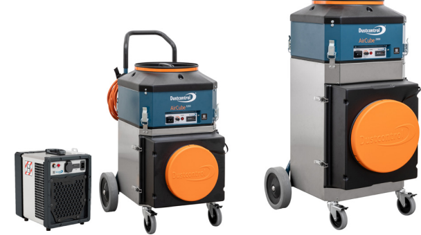
Art.nr. DC AirCube 600 112600 230 V/50 Hz Art.nr. DC AirCube 1200 103100 230 V/50 Hz Art.nr. DC AirCube 2000 103000 230 V, 50/50 Hz

Levereras med HEPA H13 filter Art nr 46378 42940 42896 Förfilter Art nr 46395 42918 42917