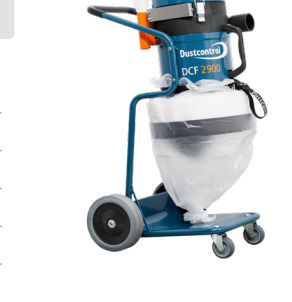
Art.nr. DCF 2900 7372 c 737200 L