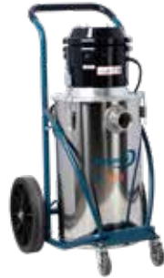
DC 50-W Art.nr 118600