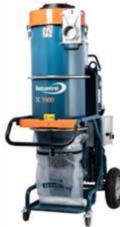
DC 5900 9,2 kW PTFE Art nr 119311

Golvslipning Navrondell Ø 300 Kapskiva Ø 300 Betongfräs Slipskiva Ø 300 Byggsåg Ø 400 Suglans Ø 76 Städning Ø 50