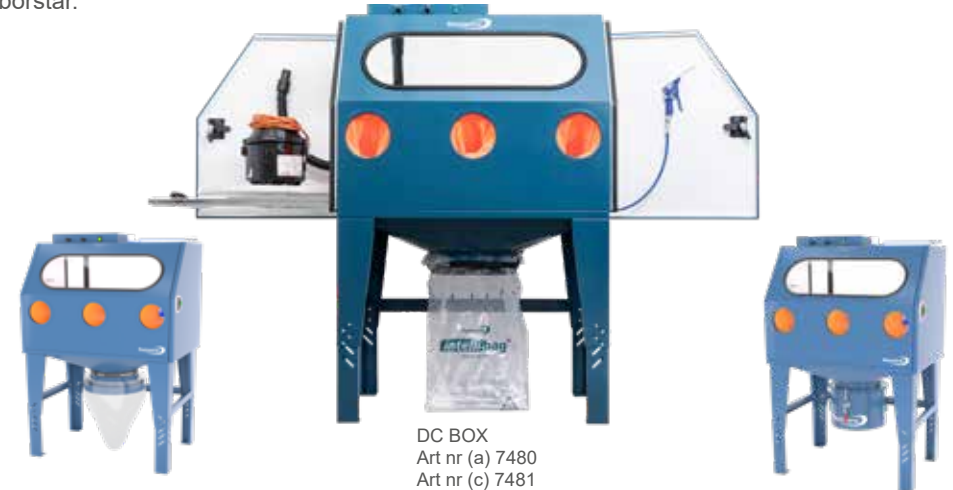
DC BOX Art nr (a) 7480 Art nr (c) 7481 Art nr (L) 7482