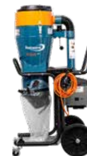
DC Tromb L Art nr 171530