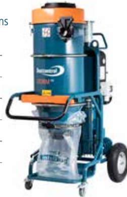
DC STORM Art nr 119403