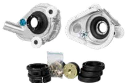
Dust Shroud Expert Nr 1