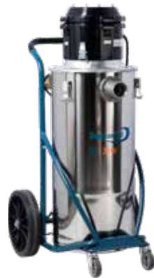
DC 75-W Art nr 118700