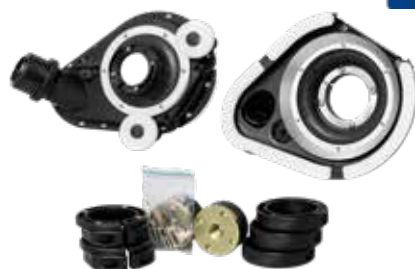
Dust Shroud Pro Nr 2

Tillbehör (art.nr.) DELUX SPANNER (46347) Verktyg för montering