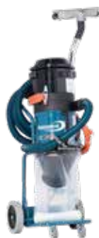
DC 2900 Auto start Art nr (a) 121100 Art nr (c) 120100 Art nr (L) 122100