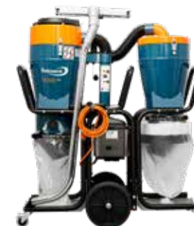
DC Tromb CC Twin finns i flera valbara utmatningsalternativ