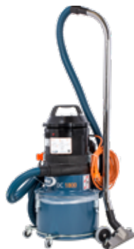
DC 1800 Auto start Art nr 101801

Borring Mindre slipstift Sticksåg & Tigersåg Navrondell Ø 125 Kapskiva Ø 125 Väggslip Ø 125 Fiberrondell Ø 125 Oscillerande maskin Städning Ø 38 Personlig sanering Mindre svetsutsug Mejselmaskin Bilningsmaskin