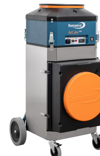
DC AirCube 2000