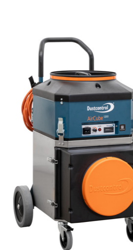
DC AirCube 1200