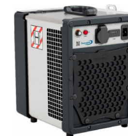
DC AirCube 600

Sugkåpa för borrhammare, bilning och mejsling. Finns i flera olika dimensioner. Kontakta oss för mer information.