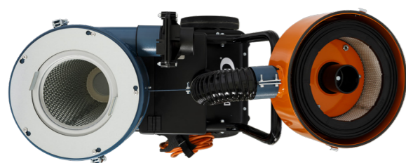
Låsring för förfilter